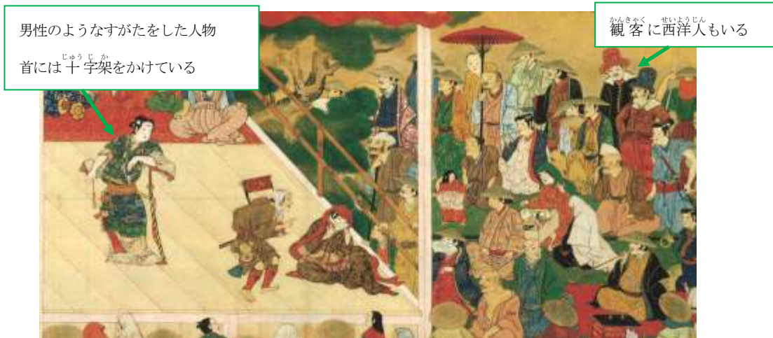
『歌舞伎図巻』(愛知県・徳川美術館蔵)

問9 下線部⑨について、当時の歌舞伎踊りを描いた下の図を解説した文(1)・(2)について、その正誤の組みあわせとして正しいものを、次のア～エから1つ選び、記号で答えなさい。